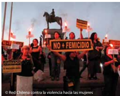
© Red Chilena contra la violencia hacia las mujeres

lado, no se ha construido información relevante a la hora de elaborar políticas públicas preventivas y de reparación para los casos de suicidios de mujeres agobiadas por la violencia constante de sus parejas, o en aquellos casos en que las mujeres matan a los agresores en defensa propia, cuando su propia vida está en riesgo.